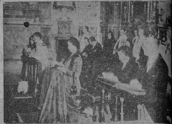
Roma. — Doña Carmen Polo de Franco, sus hijos los Marqueses de Villaverde, el Embajador de España en el Vaticano y otras altas personalidades, oran en la Basílica de Santa Maria la Mayor, durante su visita a las basílicas jubilaires.