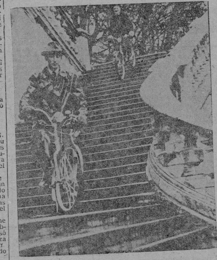
Dos mecánicos alemanes han inventado recientemente una bicicleta llamada "Preha", con la cual se pueden bajar tranquilamente las escaleras, como vemos en la presente fotografía