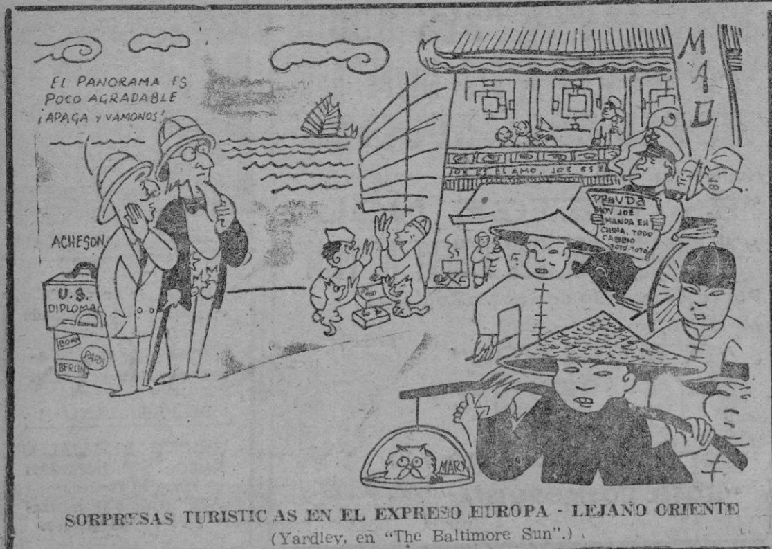
SORPRESAS TURISTICAS EN EL EXPRESO EUROPA - LEJANO ORIENTE (Yardley, en "The Baltimore Sun".)

La señora de Perón recibió la visita de su hermano Juan Duarte.