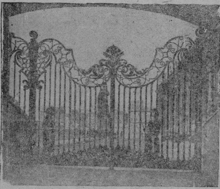
La gran verja que se encuentra a la entrada principal del Palacio del Vaticano y desde la cual se ve parte de los jardines por donde pasea por las tardes Pío XII