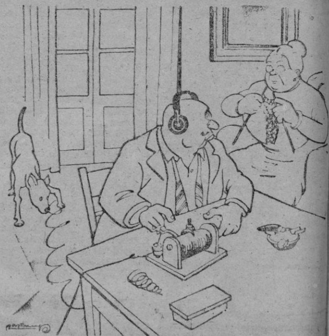
—Otra vez no se oye nada! ¿Quieres subir a la azotea a ver si los vecinos han vuelto a tender la colada en la antena?