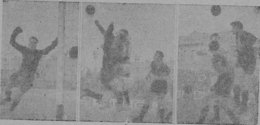
Un gol del Atlético Baleares, en el primer tiempo. — Un apurado despiece del portero reusense, protegido por dos defensas cerrando el paso a Badina. — Y Miguelín en infructuosa lucha con la defensa catalana.

parte y abrumadoramente favorable a los locales en la segunda — el colega señor Martínez Izquierdo. Mano firme en la represión del juego violento; y algún que otro error técnico en la apreciación de las faltas.