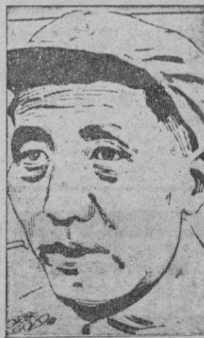
MAO TSE TUNG

En cambio, los EE. UU. reconocen los cambios territoriales conseguidos en los nuevos tratados de paz con Bulgaria, Rumania, Hungría y Finlandia y la concesión a Ucrania por Checoslovaquia de la Rutenia subcarpática.