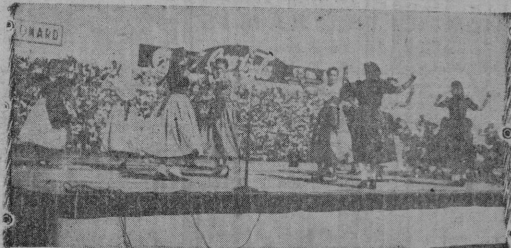
Los Coros y Danzas de España han efectuado una brillante gira por tierras sudamericanas. La foto nos los presenta en una magnífica exhibición sobre el tablado instalado en el Estadio Nacional de Lima, a la cual asistieron más de 30.000 espectadores que admiraron esta manifestación de arte folklórico español.