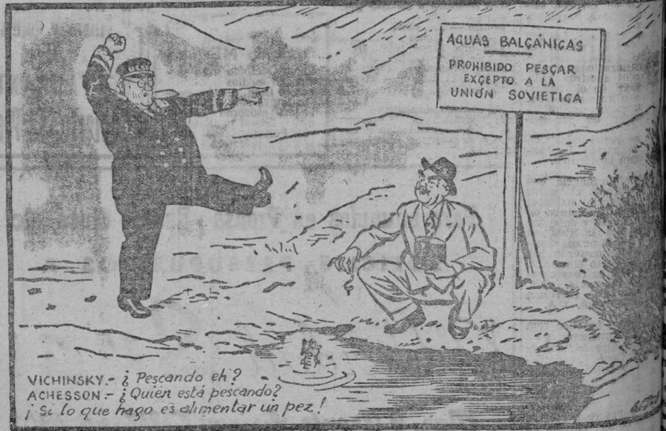
TITO, EL PEZ BALCANICO DE LA DISCORDIA