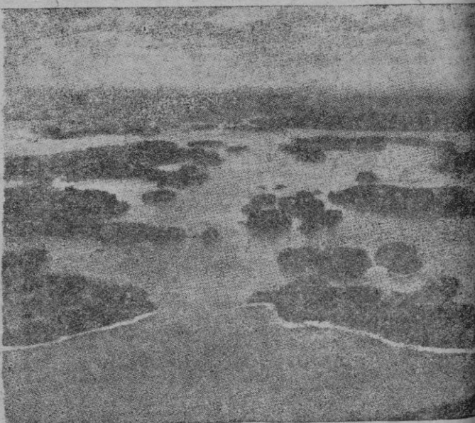
Lagos de Finlandia salpicados de islas, sobre los que penetra la luz delgada y lenta de los estios y las sombras invernales.

En aquella región desencadenado la batalla guerrilla que para los fineses tiene la importancia de una auténtica batalla. A través del Kemi se exporta la cuarta parte de la madera de la exportación. Pero en circunstancias de que ha transportada precisamente