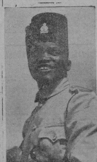
Las fuerzas de policía de Kenya han asistido a cursillos de instrucción celebrados en Nyari (Inglaterra). La foto nos presenta al jefe instructor de las mismas.