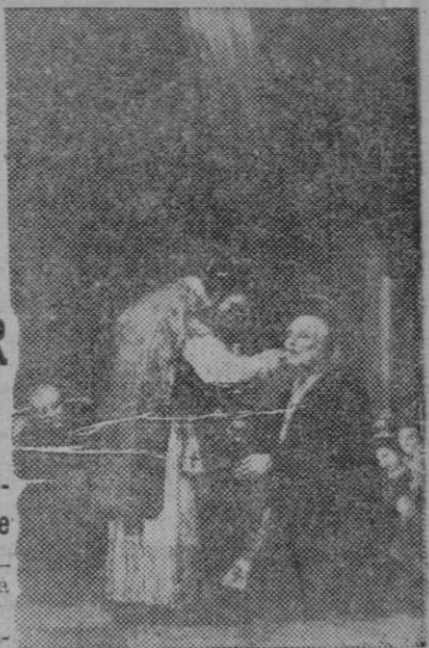
Hoy celebra la Iglesia la fiesta del fundador de las Escuelas Pías a quien el magisterio español tomó por patrono. El cuadro es el llamado "La comunión de San José de Calasanz" pintado por Goya.