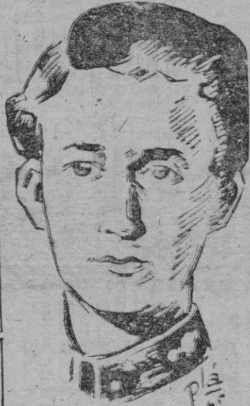
Leopoldo III de Bélgica

Reside en el mismo lugar en que vivieron la reina Hortensia y la emperatriz Josefina