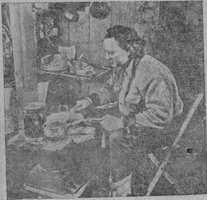
Byrd, en su primera expedición al antártico, preparándose la comida en una cocina-estufa.

moción pidiendo que las naciones del Plan Marshall adopten una política común para ahorrar dólares y reducir de sus divisas monedas intercambiables.