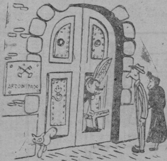
—Volved a casa. Como veis a vuestro arzobispo no le ha ocurrido nada.