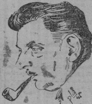
Eduardo Herriot, presidente de la Asamblea de Europa.

resistente que la de los ministros. Los delegados o diputados representan unos electores y, en definitiva, un Parlamento que se considera inestable. ¿Cómo coordinar ambas representaciones, la gubernamental de un país o de un Parlamento? Todo está, pues por empezar.