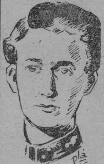
Leopoldo III de Bélgica

En este problema de vuelta del rey, hay sin embargo, dos aspectos que conviene diferenciar debidamente: uno de ellos a favor y otro adverso; el primero es la unanimidad del país — socialistas incluidos — en aceptar el reinado monárquico. Se trata de este aspecto de un caso que se parece al de Eduardo VIII de Inglaterra. También en Bélgica, el país no aceptada la monarquía pero no todos admitían el trono morganático del rey. Aunque había, sin embargo, una diferencia: Eduardo VIII estaba reinando y aspiraba casarse con Miss Simpson, esa que el impedimento era trono, por lo que pudo fácilmente ser rechazado, mientras que en el caso de Leopoldo III el impedimento, uno de ellos por lo menos, es la esposa del rey, que no puede ser rechazada porque se trata de un ilegítimo matrimonio. El problema, en las dos monarquías, quizá sea el mismo, pero calma a recorrer para desenlace es muy distinto. Esto es, precisamente lo que hace difícil y complejo el problema de Leopoldo III.