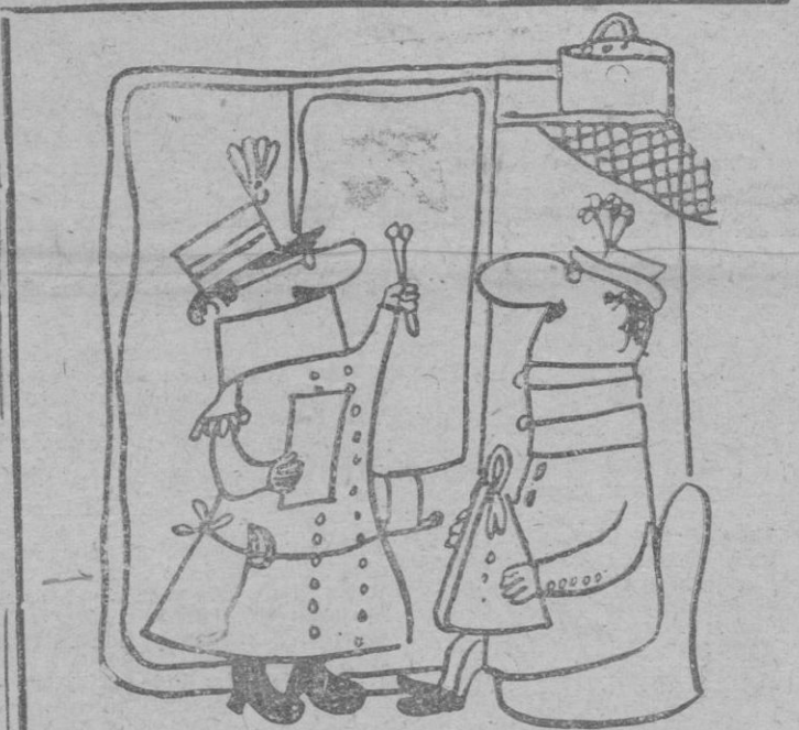
FERROCARRILES — Usted debe abonar la diferencia: en estas dos horas de viaje ha aumentado el importe del billete. (De "Candido"-Milán)

ARGEL, 29. (Efe). — Los obreros portuarios se han declarado en huelga para protestar de la designación de dos delegados de la C.G.T. — fuerza obrera anticomunista — en la comisión consultiva de puertos.