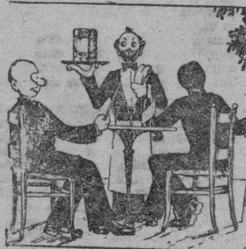
Los Barquillos Galindo son el complemento de un buen helado, se fabrican en todos los gustos. Calidades inmejorables. Calle Cordelería, núm. 14.