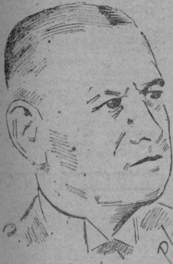
El Almirante Raeder

En presencia de observadores rusos, británicos y franceses