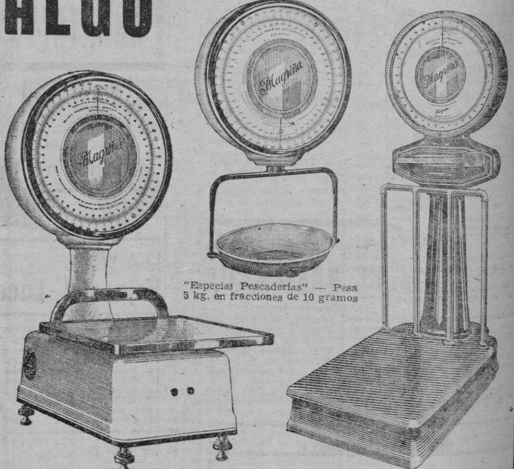
"Especial Pescaderías" — Pesa 5 kg. en fracciones de 10 gramos

Capacidad 10 y 55 kgs. en fracciones de 10 gramos Capacidad 200 y 300 kgs. en fracciones de 25 gramos.