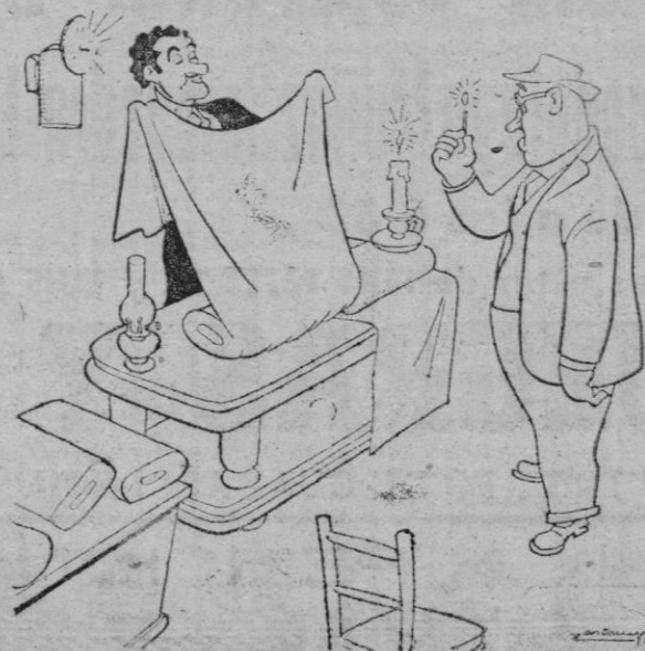
—Si, señor, por cada corte la casa regala dos cortes adicionales.