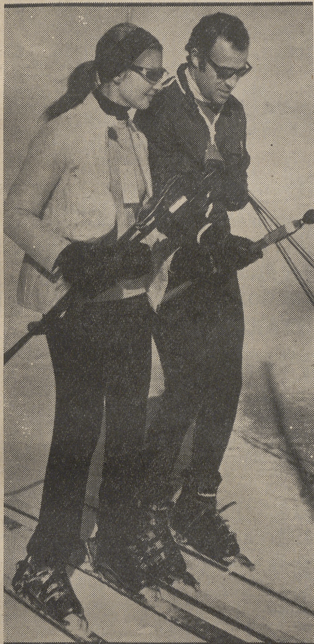
El Príncipe don Alfonso de Borbón Dampierre, y la señorita María del Carmen Martínez Bordiú, su prometida, han pasado estos días esquiando en Sierra Nevada, uno de cuyos momentos recoge el grabado.

fiscal, los cabezas de familia numerosa, categoría de honor, gozarán de exención sobre el rendimiento de trabajo personal y se reducirán estos impuestos en las cifras de 250.000 y 400.000 pesetas anuales para las familias de primera y segunda categorías, reducciones todas que se aplicarán igualmente en el impuesto general sobre la renta.