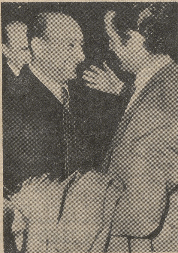
En la telefoto de Ap-Europa Press, los ministros de Asuntos Exteriores de la R. A. U. y de España, durante la visita del señor López Bravo en El Cairo.

EL CAIRO, 11 (Efe).—El ministro español de Asuntos Exteriores, don Gregorio López Bravo, ha salido hoy de El Cairo tras realizar una visita de dos días a Egipto.