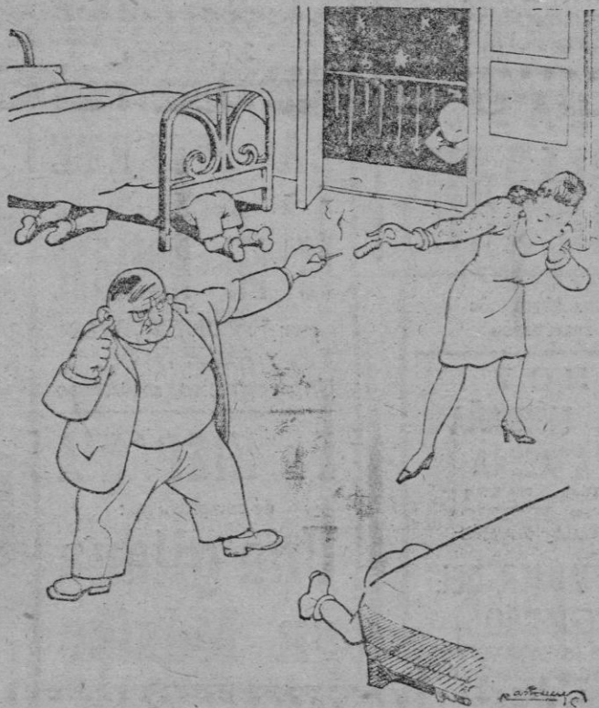
Los esposos Sistace, en obsequio a sus hijos, se disponen a encender una bengala.