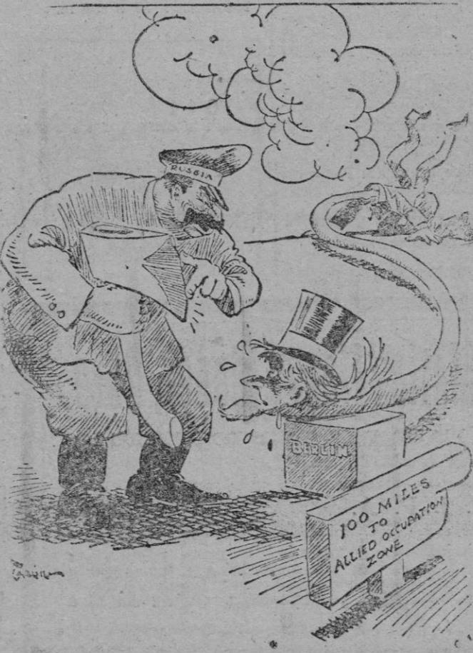
Stalin. — ¿De parece bien que cerremos trato ahora mismo?