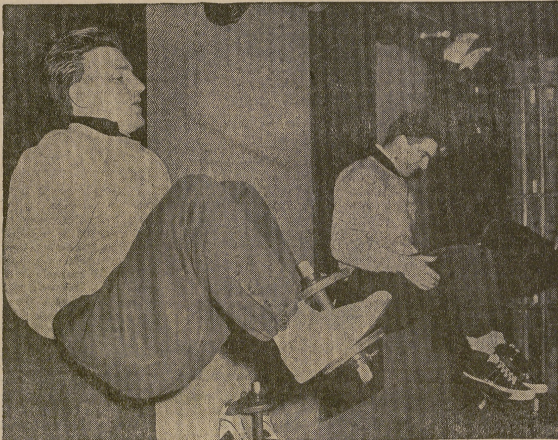
Los jugadores se entrenan levantando pesos en el gimnasio. Todos estos trabajos y algunos más se hacen para ganar al contrario