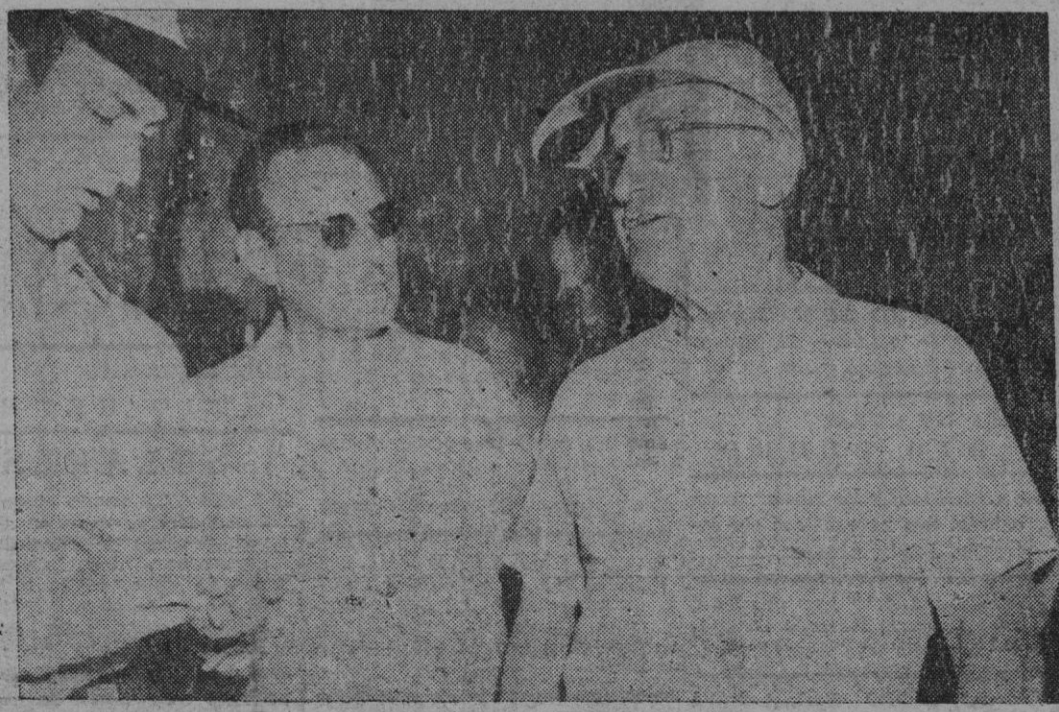
El presidente Truman, luciendo esa nueva visera deportiva, contesta algunas preguntas de los periodistas en Key West (Florida), el último día de su breve descanso en aquellas playas. Su gesto deportivo parece desafiar el coño agrio de Mojito.