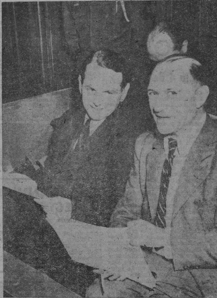
De izquierda a derecha vemos al brigadier general Hémz Jost y al mayor general Otto Ohndorf, sentados ante el tribunal de crimenes de guerra con sede en Nuremberg (Alemania). El primero actuó en el Báltico, como jefe del grupo anfibio A, y el segundo operó mayormente en el sur de Rusia, en calidad de jefe del grupo D.