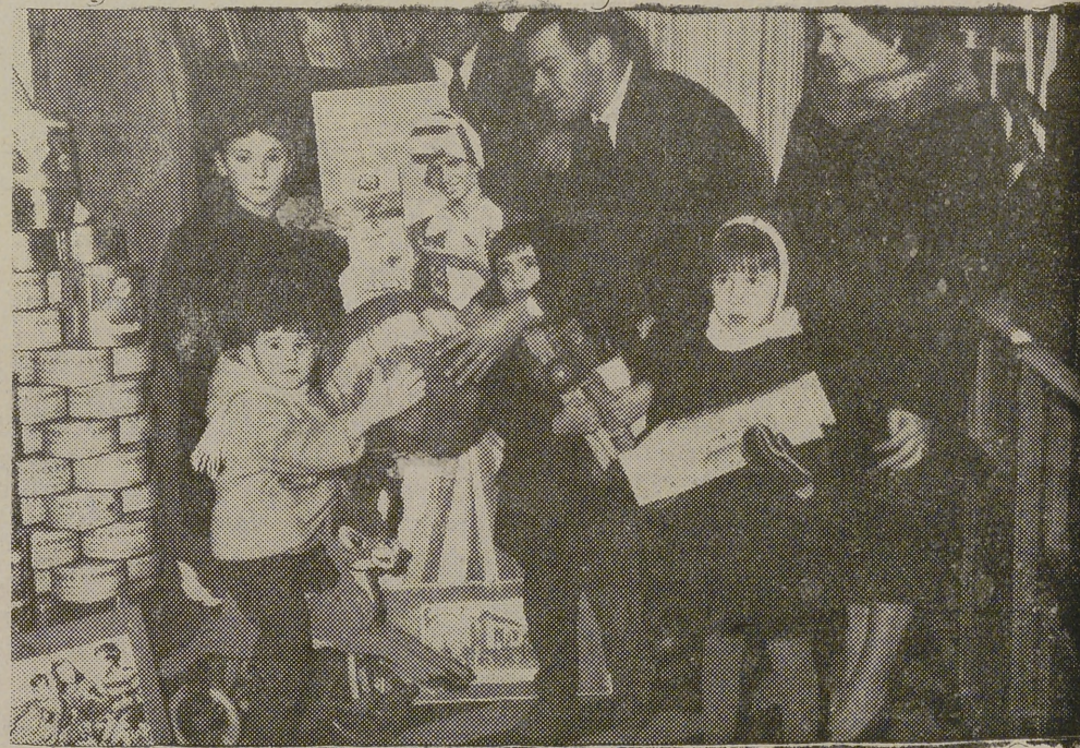
Un momento de la entrega de los juguetes que pidieron los niños a los Reyes Magos en carta ELGORRIAGA y que fueron favorecidos por el