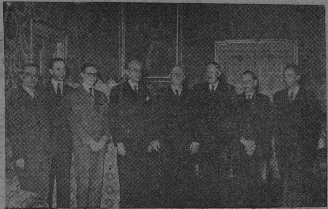
El ministro de Asuntos Exteriores, conde Sforza (en el centro), junto al embajador inglés Sir Victor Mallet, con los delegados ingleses y franceses antes de dar comienzo las conversaciones sobre la fase ejecutiva del Plan Marshall.