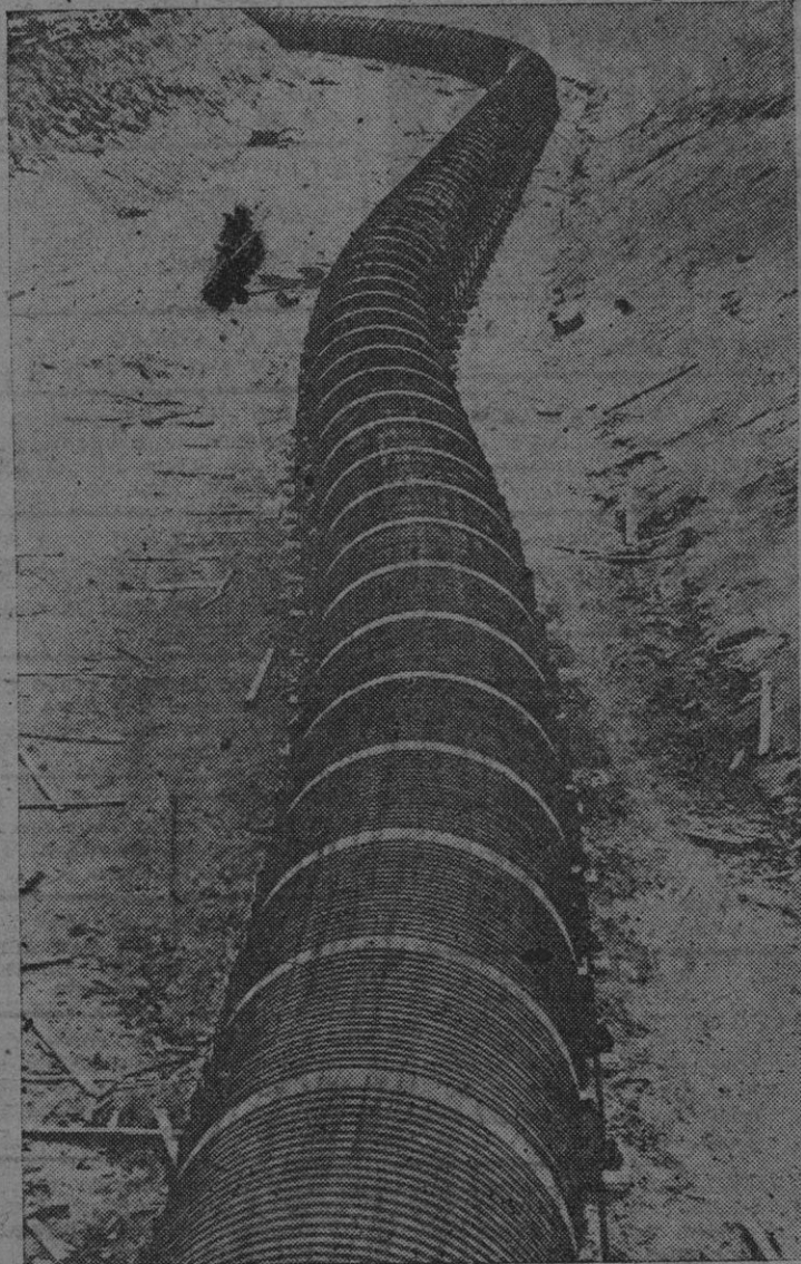
Esta enorme tubería de casi dos kilómetros de longitud y cuatro metros de diámetro, ha sido construida para suministrar energía a la isla de Vancouver. Para ello se ha formado un lago artificial de 200 acres, aprovechando el agua del río Campbell. El líquido elemento, a través del colosal conducto, es conducido a la estación generadora, donde se transforma en energía eléctrica.