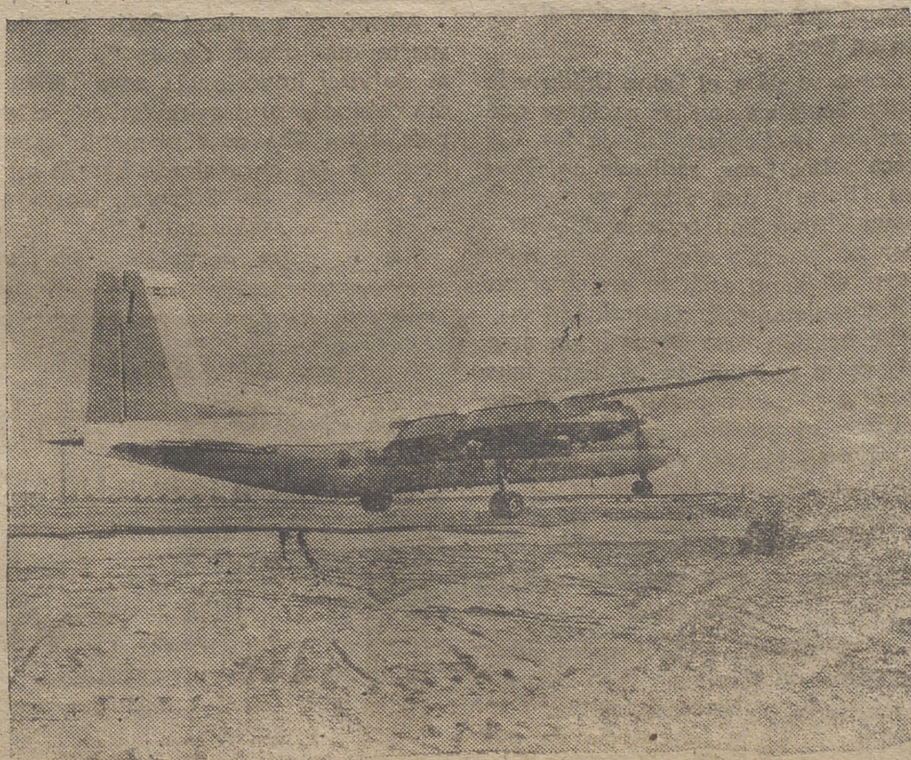
Este es un gran avión que realiza un gran viaje de ventas por varios países euro-asiáticos. Vende aviones ingleses