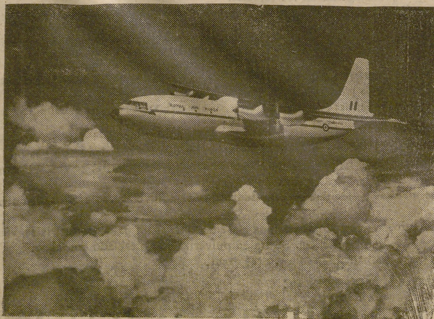
Un artista da esta impresión del «Belfast», nuevo avión de carga del que ya se han pedido diez ejemplares para el Mando de Transporte de la Real Fuerza Aérea Inglesa.