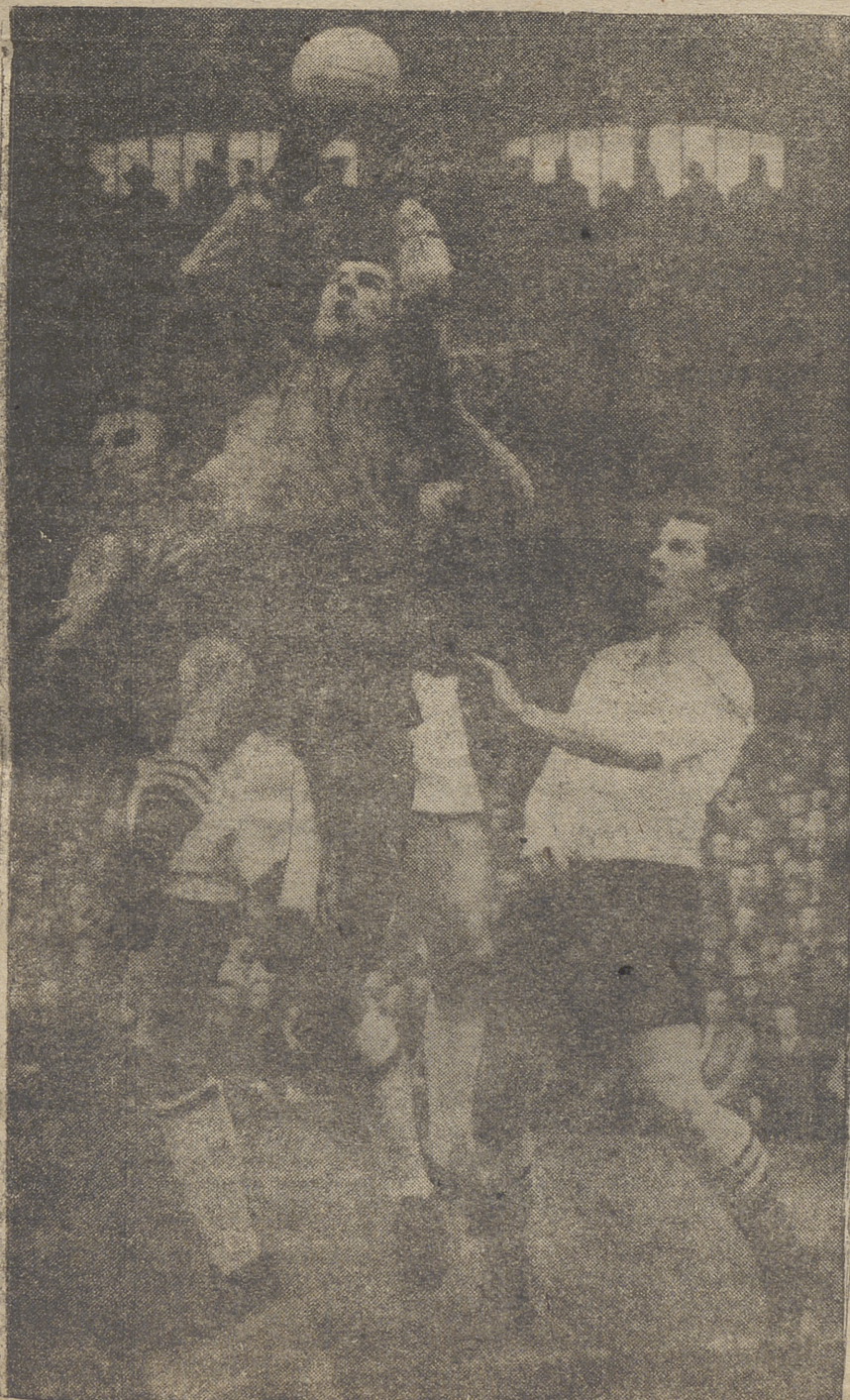
He aquí una foto bonita y expresiva. El tema surgió en un entrenamiento