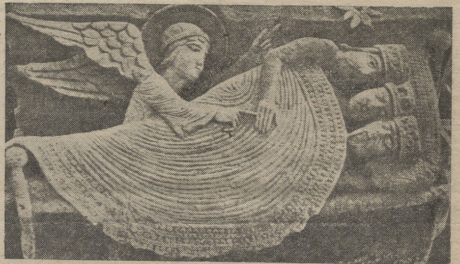
Catedral de Saint-Lazare. AUTUM (Francia).

La representación escultórica que nos queda por consignar, es a nuestro juicio la mejor con ser la más antigua. Nos referimos al frontal posterior del sepulcro de San Vicente en la iglesia de este mismo nombre; una de las mejores piezas sepulcra-