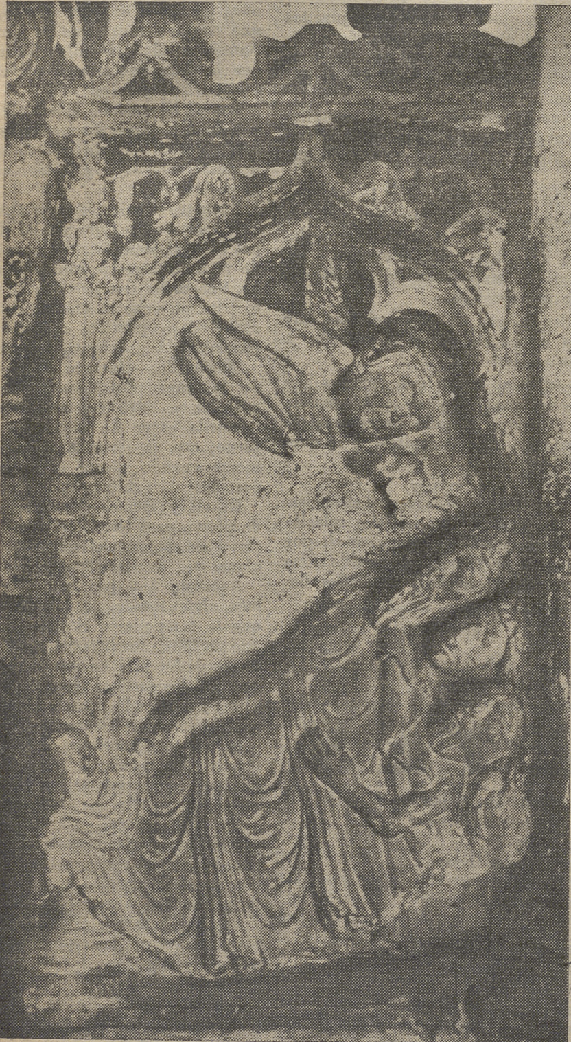
Basílica de San Vicente. AVILA.

Pero no es el dormir en cama redonda el único parecido entre ambos retablos. En ambos, los tres Reyes duermen con las coronas puestas, sin duda para que se les reconozca. En ambos, aparece de manera ostensible la manta o cobertor que les arropa. En ambos hay uno de los Reyes que duerme con un brazo fuera de la ropa. En ambos aparece un ángel para darles el aviso de que se aparten de Herodes, sin más diferencia que el ángel de la Catedral de Autum está de pie sobre el suelo y el de San Vicente aparece sobrevolando la cama. En ambos, uno de los Reyes tiene buenas barbas, otro sólo bigote y el tercero, que en ambos casos es el que duerme en medio, está completamente afeitado o lampiño.