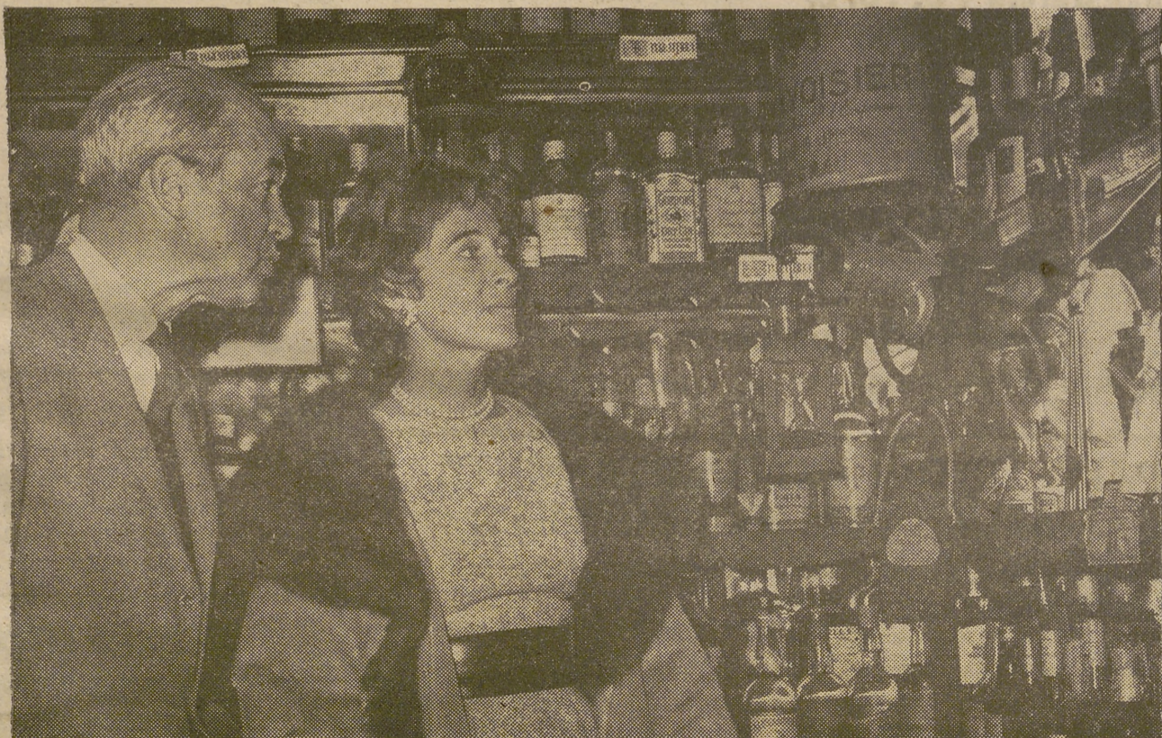
Como ya se sabe, el famoso actor cinematográfico James Stewart ha pasado unas jornadas en Madrid de donde marchó a la Mancha para asistir a una fiesta cinegética. Durante su estancia en la capital de España, Stewart visitó, acompañado de su esposa, el famoso museo de bebidas de Perico Chicote. Este es el momento que ofrece la foto de Cifra Gráfica. Los esposos ofrecen una expresión admirativa al contemplar la diversidad que ofrece la exposición.