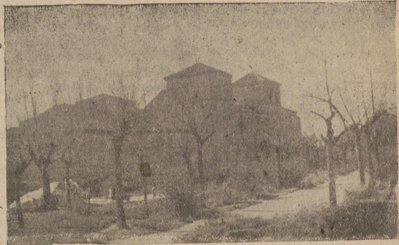
Palacio de Don Juan II donde nació Isabel «la Católica»

Es la casa natal de Isabel «la Católica»