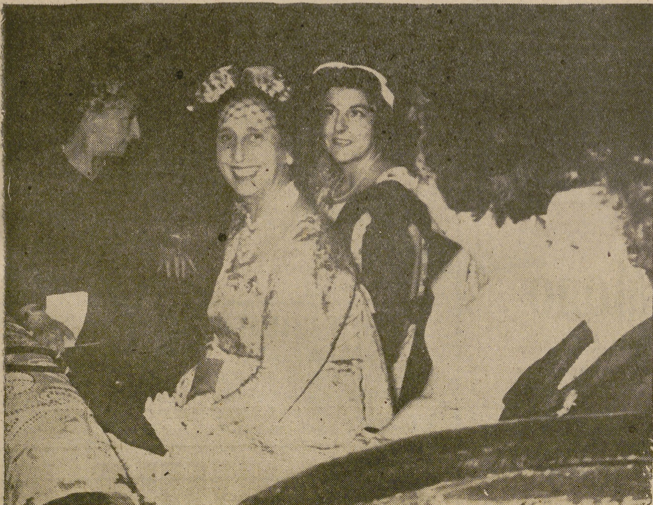
La Junta Protectora de Damas Catequísticas organizó en La Coruña una gran función benéfica, a la que asistió la Excm. señora doña Carmen Polo, esposa del jefe del Estado. Doña Carmen apareció en la foto de Cifra Gráfica, acompañada de distinguidas damas, en el palco que ocupó durante la función en el teatro Rosalía de Castro, presenciando la actuación del Ballet Gallego.