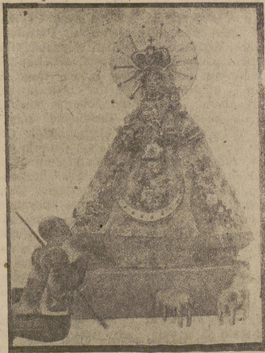
Imagen de Nuestra Señora la Virgen del Cubillo que se venera en el magnífico Santuario de Aldeavieja.