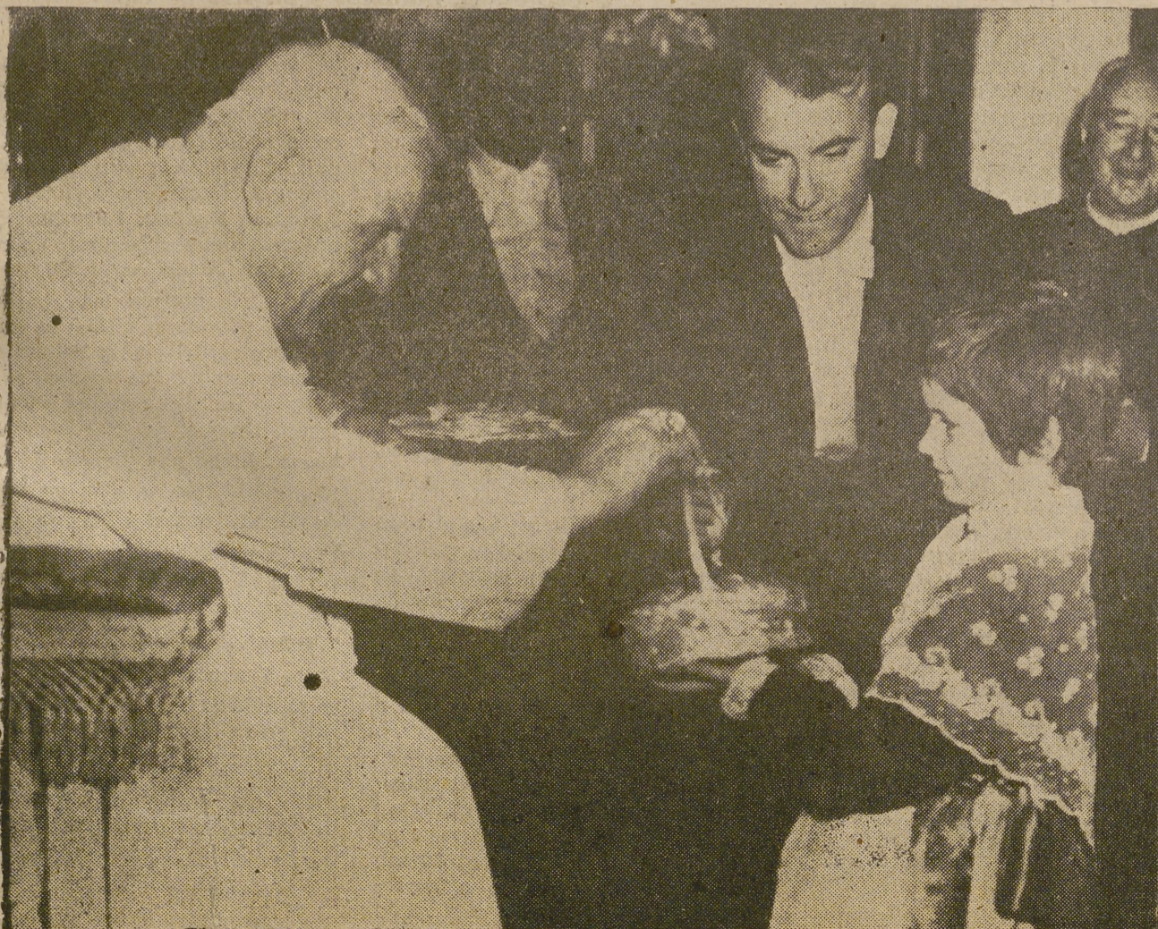
Castelgandolfo celebra anualmente una alegre fiesta infantil: la fiesta de los melocotones. Durante ella, los niños de la residencia veraniega de Su Santidad se acercan al Papa para ofrendarle los mejores de aquellos frutos. Este es el momento que recoge la foto de Cifra Gráfica, en la que se ve a una niña a los pies de Juan XIII para hacerle la ofrenda.

Homenaje a la venerable Madre Catalina del Espíritu Santo (Página 5.ª)