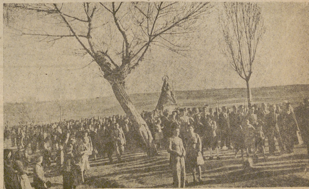
En vísperas de la coronación de la Virgen de Sonsoles, camino de Avila, viene desde su Santuario la imagen, acompañada de sus fieles hijos..

Servicio de coches al Santuario a las seis y cuarto de la tarde.