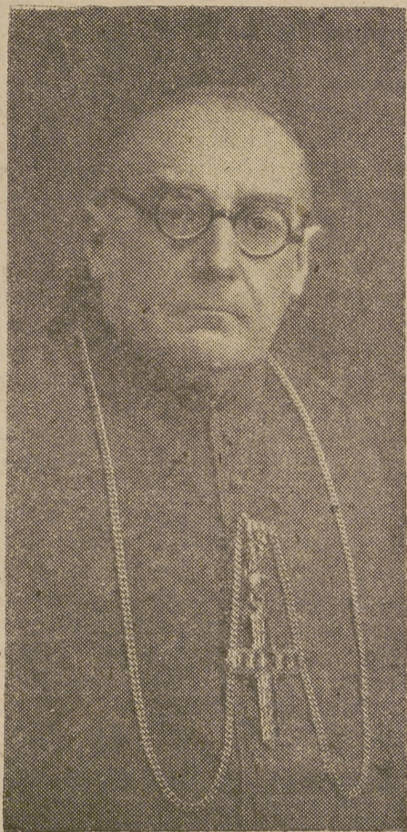
El Emmo. Sr. Cardenal Pla y Daniel Arzobispo de Toledo, que hace veinticinco años, siendo Obispo de Avila, coronó canónicamente a la imagen de Nuestra Señora de Sonsoles.