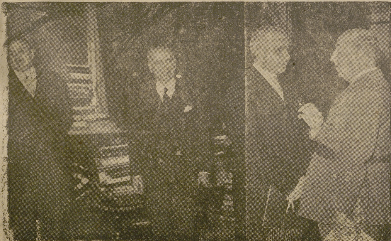
MADRID.—Su Excelencia el Jefe del Estado durante la audiencia concedida a la Comisión asesora de Investigaciones Científicas y Técnicas, prestada por el señor Lora Tamayo, que le hizo entrega del informe de las reuniones celebradas.—.