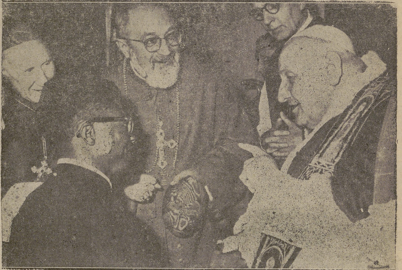
El cardenal Agagianian, proprefecto de la Sagrada Congregación de Propaganda de la Fe ha dirigido al excelentísimo señor arzobispo de Burgos una carta que reproducimos en otro lugar de este número. En la foto aparece el cardenal Agagianian con el Papa Juan XXIII, cuando se despedía de Su Santidad para asistir recientemente en Mantla, como legado, a los actos inaugurales de la Catedral.