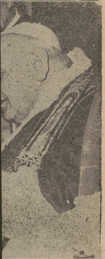
de la Fe ha dirigido al excelente número. En la foto aparece para asistir recientemente en el...