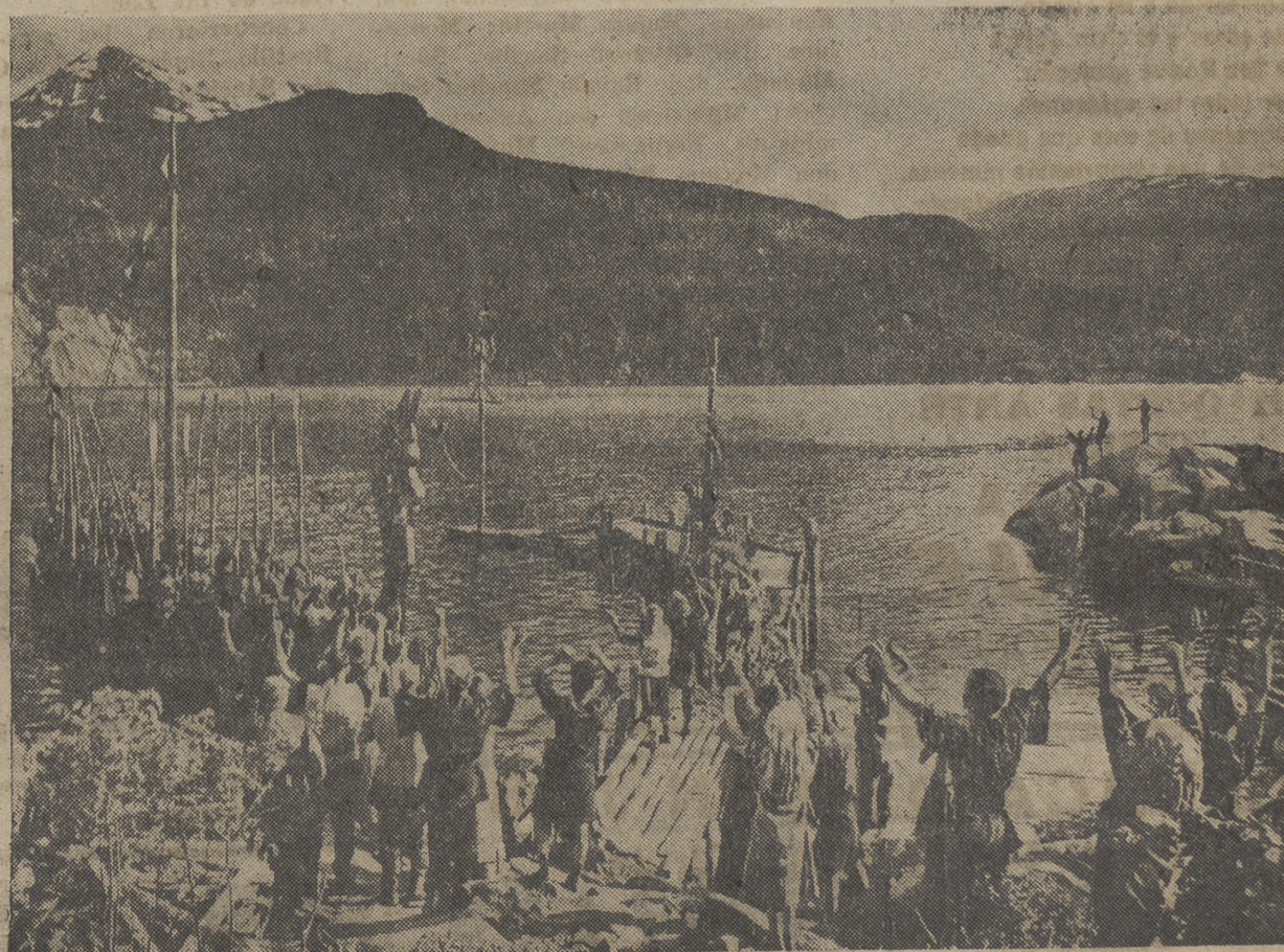
Esta fotografía pertenece a la película «Los vikingos», que ha producido Kirk Douglas. Es la llegada victoriosa de los vikingos, a los que su pueblo espera con los brazos levantados. Los principales intérpretes de la cinta son Ernest Borgnine, Kirk Douglas, Tony Curtis y Janet Leigh. El barco que surca las aguas—y como éste muchos—han sido construidos exclusivamente para realizar la cinta.