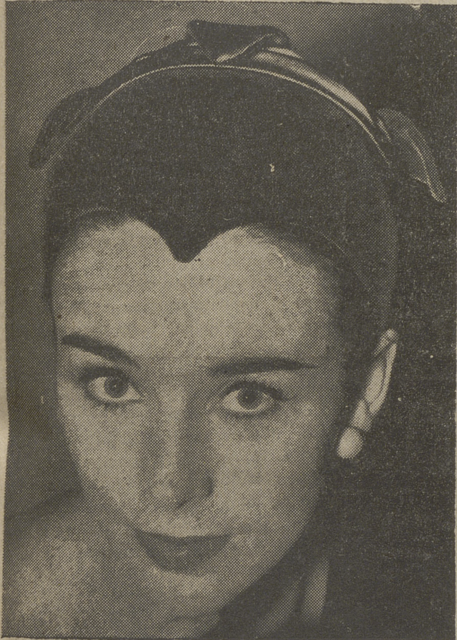
En Londres, y por la firma Davies, ha sido presentada esta moderna creación de sombrero bautizado con el nombre de «Bufón». Pero un bufón muy actualizado de cara a la era interplanetaria. De la moda de la época de las cavernas a la de la edad atómica, pasando por la capital británica.