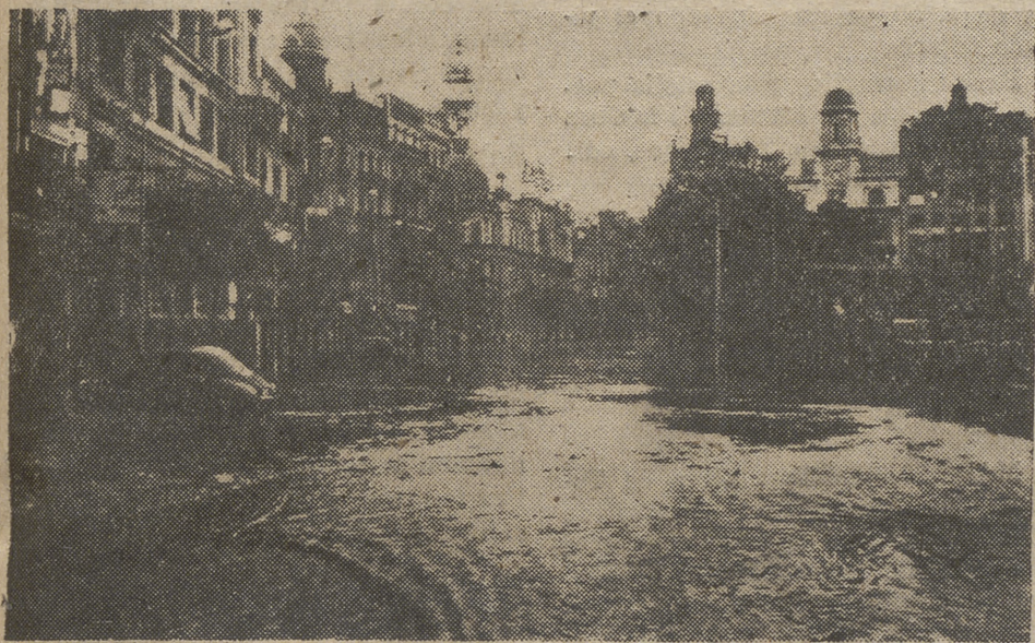
El furioso Turia se desbordó por calles pasando de este modo por la Plaza del Caudillo

Los abulenses responden al llamamiento del excelentísimo señor gobernador civil