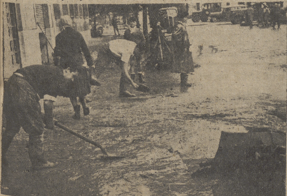
Al bajar el nivel de las aguas desbordadas, el vecindario procede a la limpieza de cieno y barre las naves inundadas y las aceras de las calles. No están solos los valencianos en su desgracia, porque su dolor es dolor de toda España. Y España se ve acompañada por buenas gentes, principalmente del Mundo católico y el consuelo de la oración del Padre Santo.