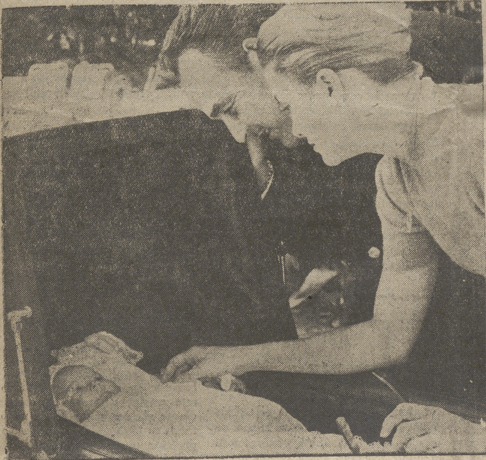
Los Príncipes de Mónaco aparecen en esta fotografía junto a su hija la Princesa Carolina. Desde su nacimiento los reporteros gráficos no la han dejado un momento de enfocar con sus cámaras.