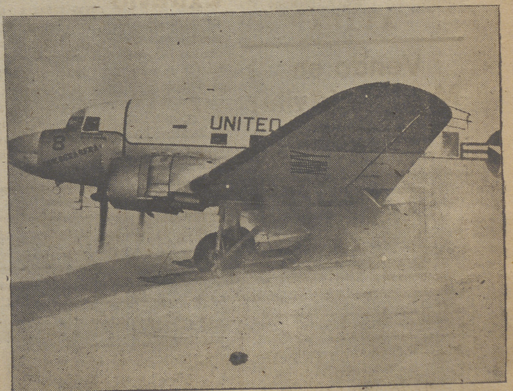
Este avión norteamericano que vemos en el Polo Sur, está realizando una misión para el Año Geofísico Internacional. Ha sido el primer avión que ha tomado tierra en estas regiones. (Foto gentileza de la Embajada norteamericana).