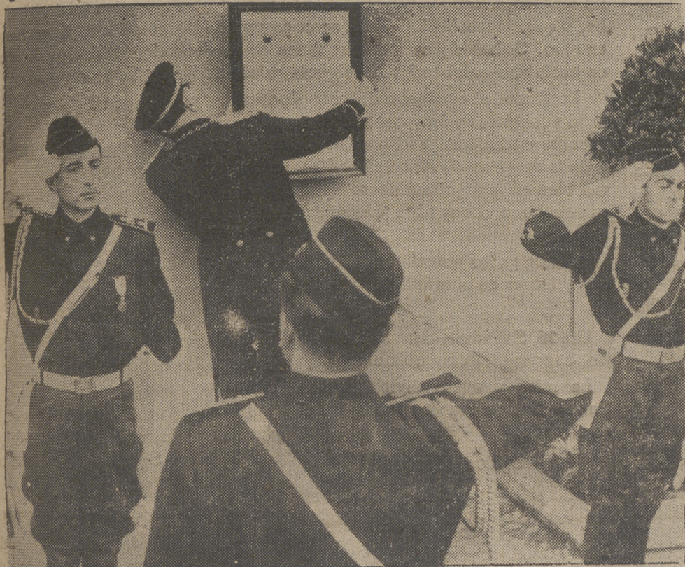
Este guardia que ven en la fotografía, con la solemnidad que el caso merecía, está colocando en la pared del Palacio de Mónaco la proclama con la feliz nueva: ha nacido una princesita.