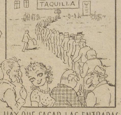
HAY QUE SACAR LAS ENTRADAS QUE LUEGO VA A HABER PATADAS