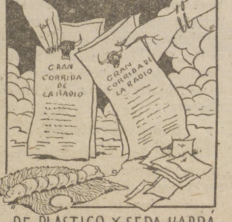
DE PLÁSTICO Y SEDA HABRÁ CARTELES PARA ANUNCIAR