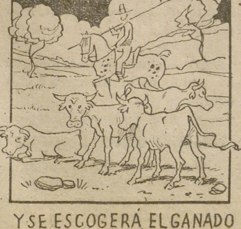
Y SE ESCOGERÁ EL GANADO QUE LUEGO SERÁ LIDIADO