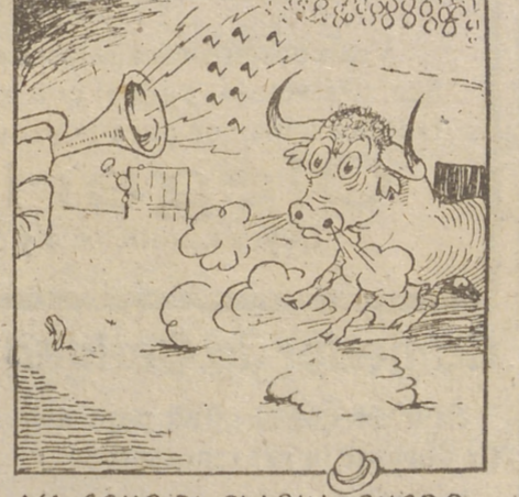
YA SONO EL CLARIN SONORO Y APARECE EL PRIMER TORO