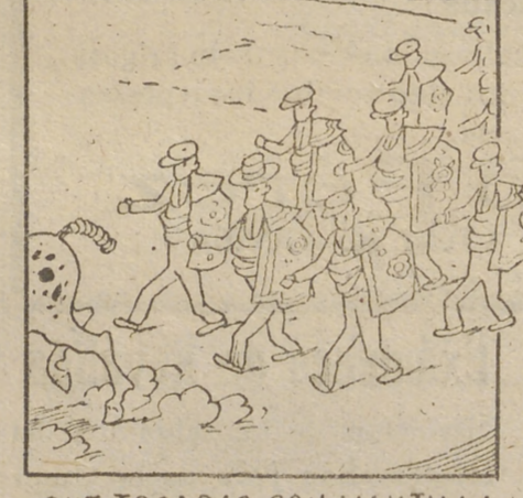
QUE TOCADAS CON MANTILLA RECIBIRÁN LAS CUADRILLAS