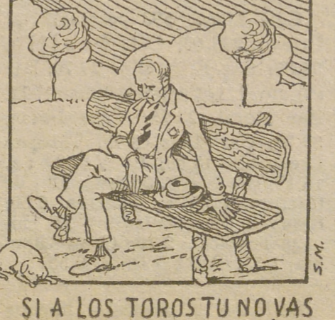
SI A LOS TOROS TU NO VAS SEGURO TE ABURRIRÁS