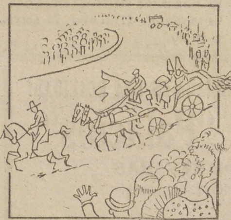
RECORRERÁ LA CIUDAD LA CABALGATA TRIUNFAL