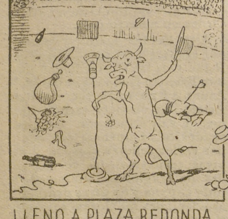
LLENO A PLAZA REDONDA ...Y RISA. ¡VA A SER LA MONDA!