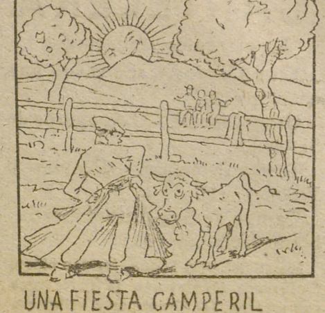
UNA FIESTA CAMPERIL HA DE HABER EN BECERRIL