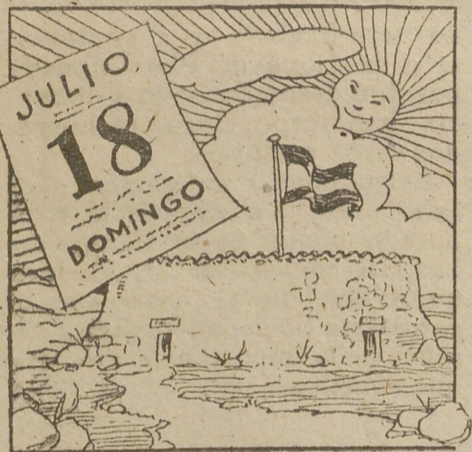
EN JULIO, EL DIA 18 HABRÁ FIESTA EN NUESTRO COSO