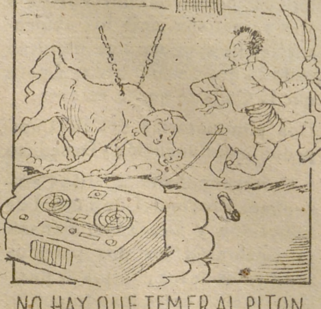
NO HAY QUE TEMER AL PITON PORQUE HABRÁ MAGNETOFON