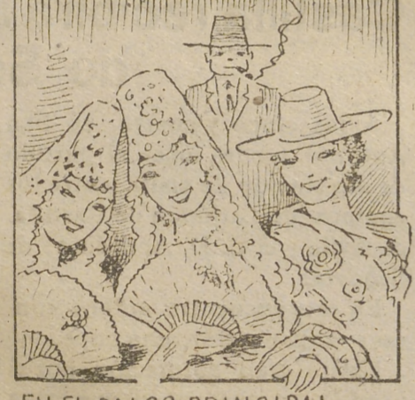
EN EL PALCO PRINCIPAL BELLAS MUJERES HABRÁ