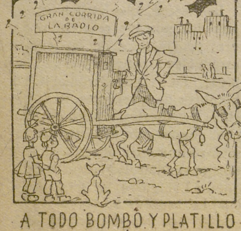
A TODO BOMBÓ Y PLATILLO LO ANUNCIARÁ EL ORGANILLO