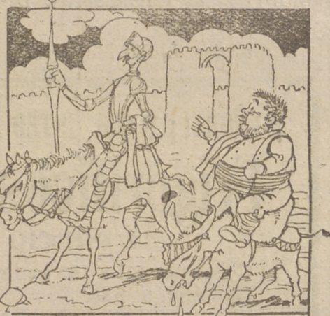
NO FALTARÁN EN LA DANZA D. QUIJOTE Y SANCHO PANZA