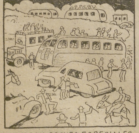
VENDRÁN COCHES ESPECIALES DESDE TODOS LOS LUGARES