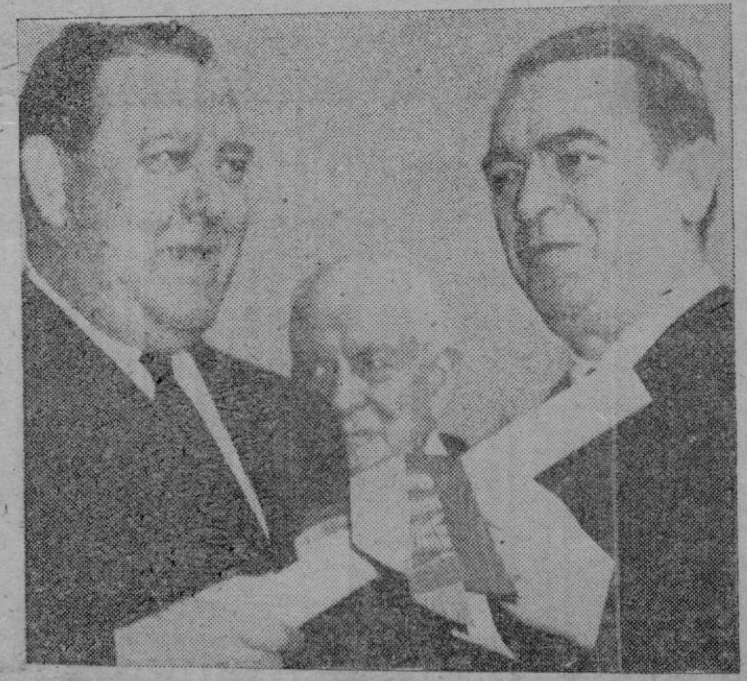
William O'Dwyer, alcalde de Nueva York, entrega a mister Trygve Lie, secretario general de la O.N.U., el título de propiedad de los terrenos cedidos por Rockefeller para que sea edificada en ellos la sede de este organismo.