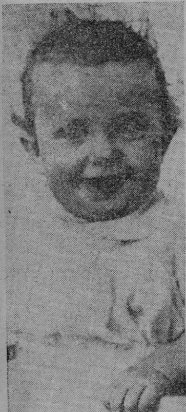
El joven príncipe Carlos Gustavo de Suecia es el heredero del fallecido hijo del actual monarca de aquel país, el rey Gustavo, de 69 años de edad. Carlos Gustavo, niño de pocos meses, heredará el trono de su país a la muerte de su anciano abuelo.