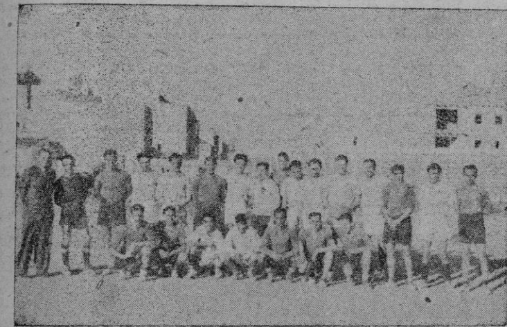
Vencedores y vendidos a campeones y «consolados». Este podría ser el título de una obra sobre el partido de ayer en «Buenos Aires». Nosotros solo afirmaremos: veintidós que no se dividen en once y once, sino en unos buenos camaradas de Artes Gráficas dispuestos a bati-

poner en aprieto las defensas corréistas... Y así un buen rato. Sus líneas implacables e impecables en el pase lo hicieron todo. El trió defensivo se vió en muchos apuros, que fueron salvados por el guardameta. Pero el susto, el susto, no nos lo quitaba nadie. Y lo que son las cosas. Nieto, el interior izquierdo del "Correo" en un barullo "ante portam enemican" — cuestión tan