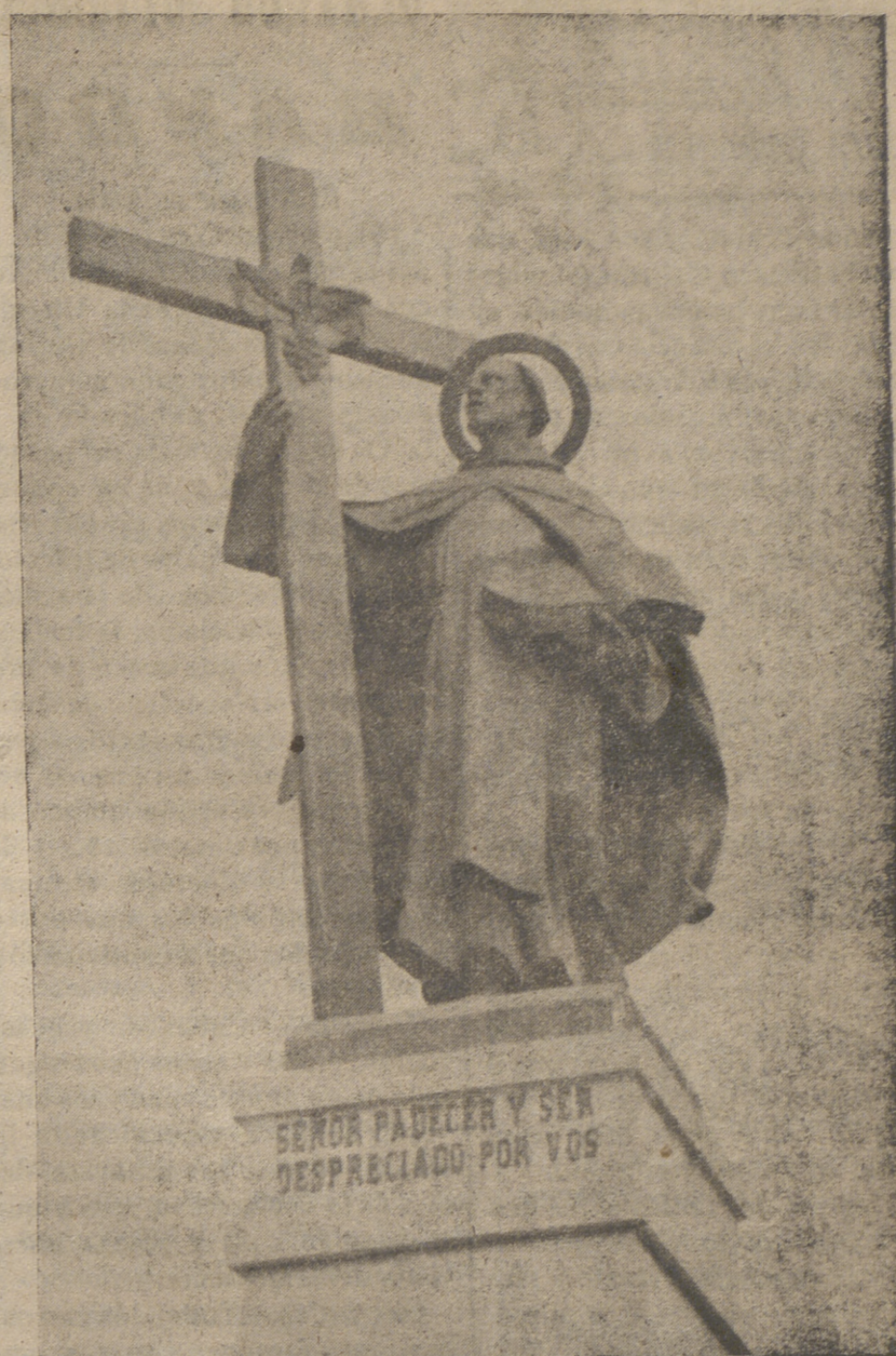
Monumento del Santo en Fontiveros.

nacimiento. La madre de éstos gemelos ha dado a luz recientemente una niña normal.