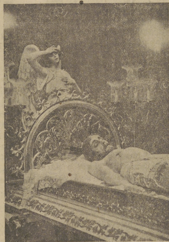
Magnífico «paso» del Entierro de Cristo que se venera en el monasterio cisterciense de Arévalo.

El 28 de marzo de 1515 nació Santa Teresa de Jesús. No podemos nosotros los avileños dejar pasar desapercibida efeméride tan