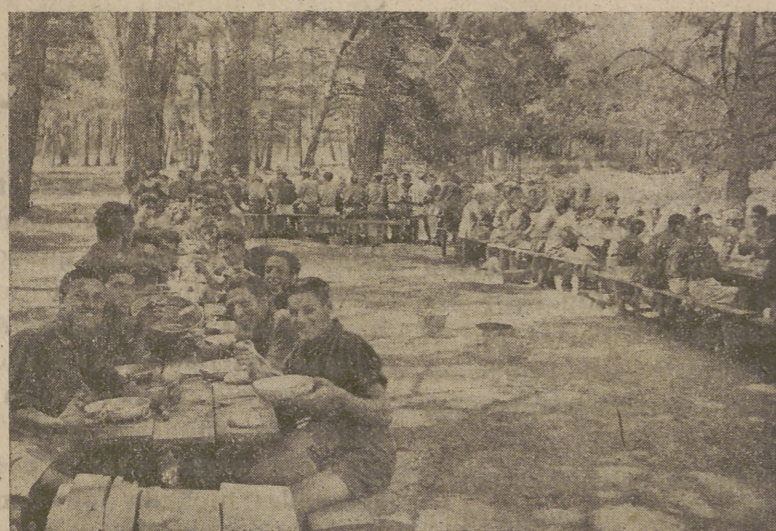
Vista del comedor del Campamento Provincial de Avila «16 de Junio de 1935»

A las diez suena la retreta y los acampados se retiran a sus tiendas para acostarse. El silencio se oye más tarde, apagándose las luces del campamento y exigiéndose un silencio completo en todas las tiendas.