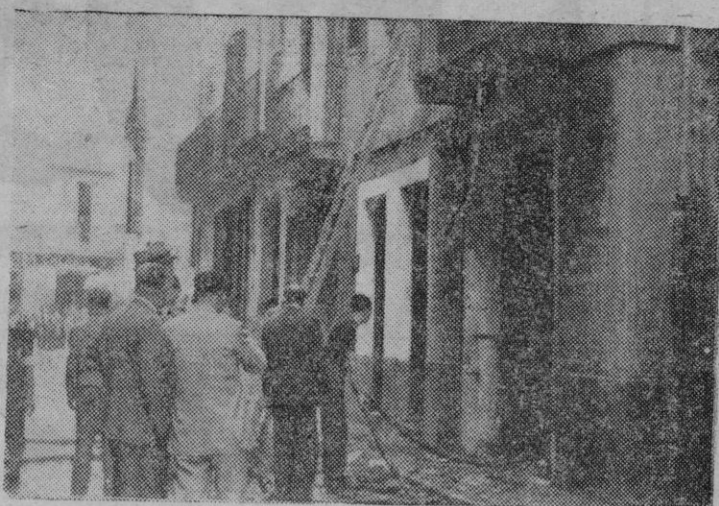
Aspecto de la fachada de la "Agencia Expres" durante los trabajos de extinción.