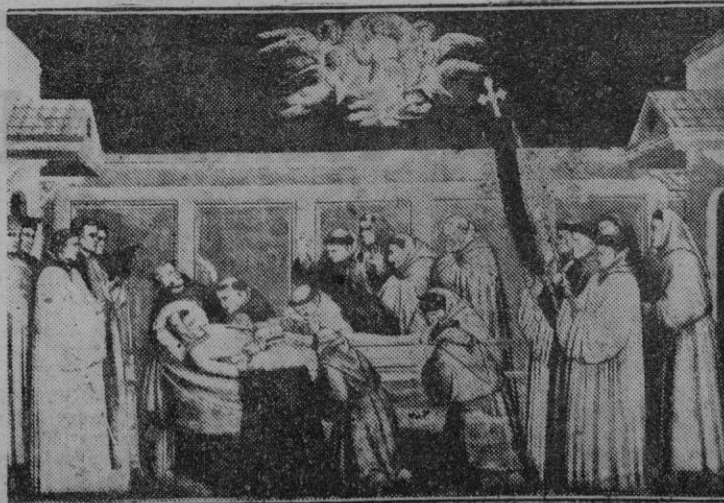
La muerte de San Francisco de Asís. Fresco del Giotto existente en la iglesia superior de la basilica de Asís.