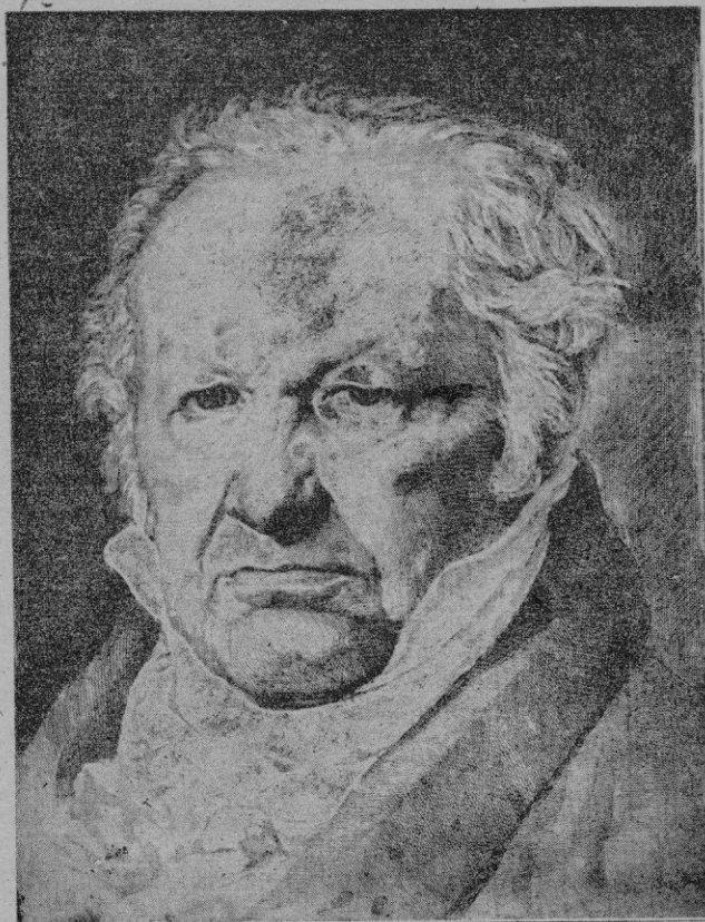
DON FRANCISCO DE GOYA

Al pintor le interesa, y es eso lo que trata de destacar, la barbarie de la guerra con su seducida de negación de los valores humanos. Pero más que espectador, que censura con la pedantería de un dómine, es el alma que siente la tragedia que vive y que la expresa de un modo rotundo y tremendo porque a pesar de sus simpatías enciclopédicas, que no pueden desconocerse, sintió el patriotismo como lo sintieron los legisladores de Cádiz; por eso exaltó el