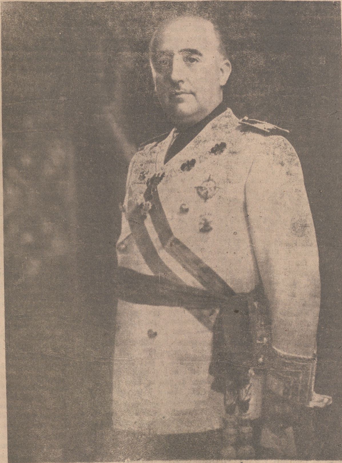
¡Dios guarde al Caudillo!

Y Franco luchó victoriosamente frente a todas las circunstancias que le eran adversas; encontrando para su obrar los auxilios necesarios. Es que nuestro Generalísimo poseía fe ciega en la Providencia Divina y esto le bastaba. Tenía muy dentro de su alma cristiana aquella famosa frase de nuestra Santa, cuya mano sigue presidiendo en su palacio de El Pardo todas sus actividades estatales: «Quien a Dios tiene, nada le falta; sólo Dios basta». Y no se temblaba cuando por la radio roja Indalecio Prieto, lleno de soberbia, cual otro Goliat, clamaba como un energúmeno a los socialistas de España: «La victo-