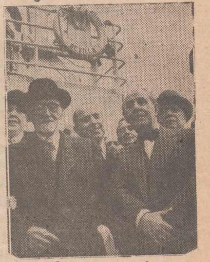
El ilustre dramaturgo español don Jacinto Benavente es recibido en el puerto de Barcelona por una comisión de la Sociedad de Autores de España y diversas personalidades.

El recibimiento tributado por Madrid a Benavente ha tenido el carácter de homenaje ferviente a quien acaba de honrar a España al otro lado del mar.—(Cifra).