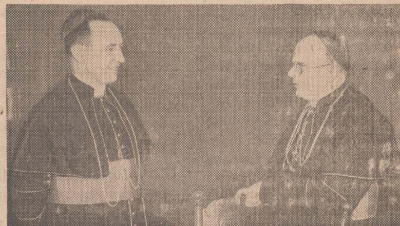
A la izquierda, el Arzobispo Gilroy, de Sidney, charlando con el Arzobispo de Westminister, monseñor Bernard Griffin, ambos Cardenales creados por Su Santidad en el Consistorio último celebrado en el Vaticano