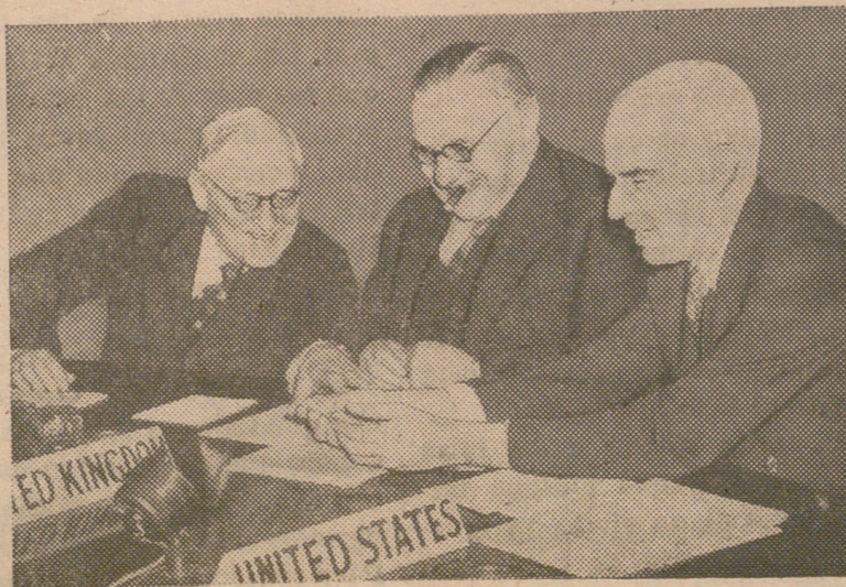
De izquierda a derecha: M. Vishinsky (U. R. S. S.), Mr. Ernest Bevin (U. K.) y Mr. Stettinius (U. S. A.) en conversación sobre el desarrollo de la Conferencia de las Naciones Unidas.