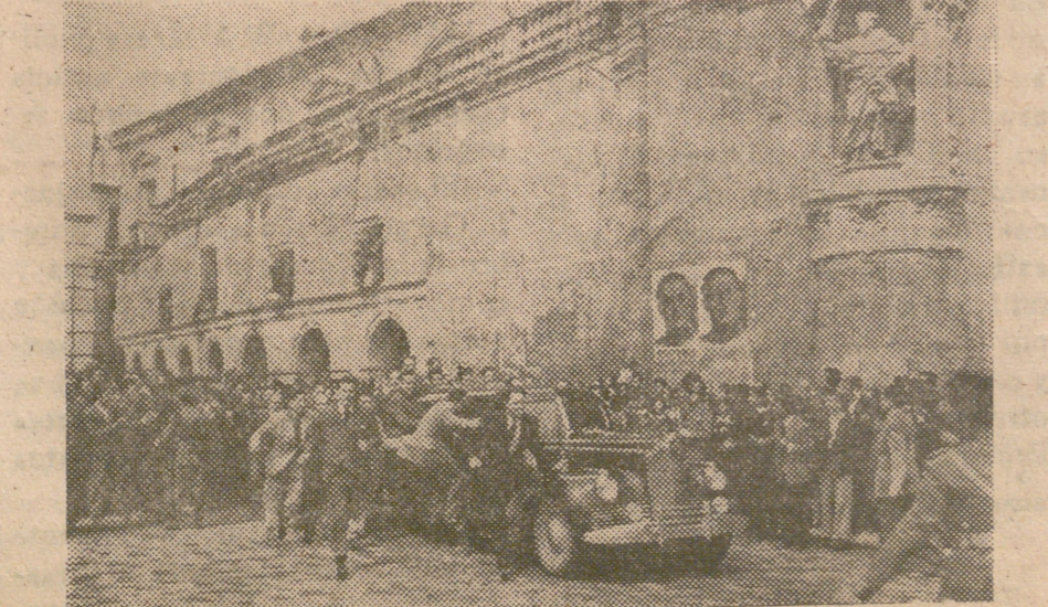
El Caudillo a la entrada de Murcia fué acogido por la multitud cuando se dirigía a la plaza del Cardenal Belluga. En el trayecto el entusiasmo desbordante dificultaba el paso del vehículo que conducía al Generalísimo

Colabora en la Cuestión de «AYUDA JUVENIL» del día 2, así cooperarás con la Sección Femenina en su tarea de proporcionar medicinas, libros y becas de estudio y talleres a las niñas de España que lo necesitan.