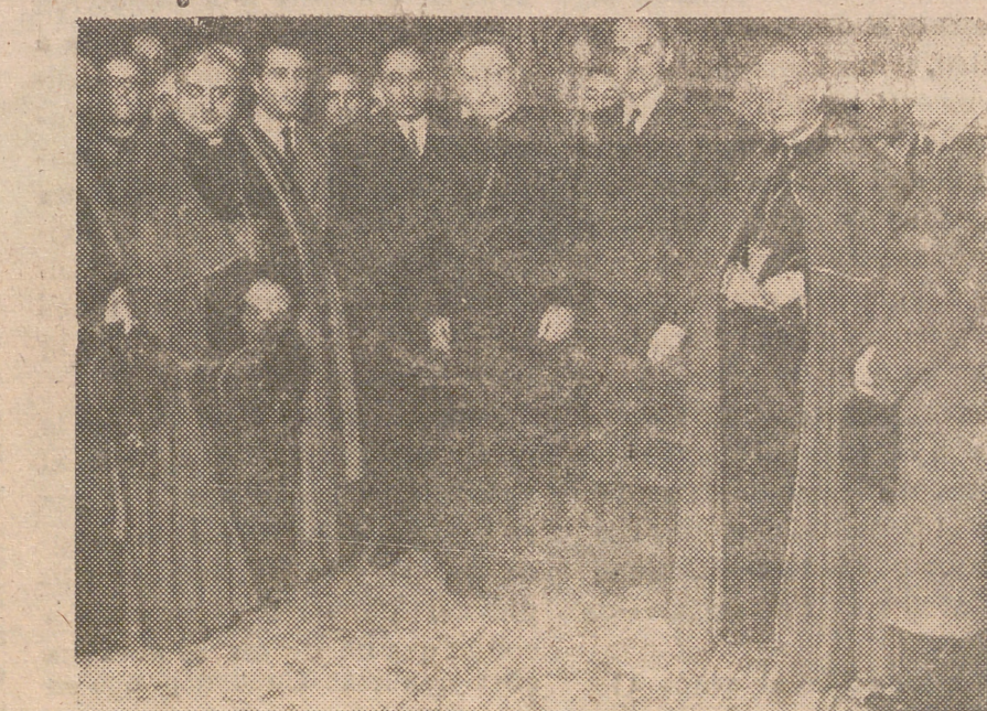
Procedente de Barcelona ha llegado a Madrid el Cardenal Arzobispo de Rosario, Monseñor Caggiano, acompañado del Obispo de Tucuman. Fué recibido por el Obispo Auxiliar de Madrid-Alcalá, doctor Morcillo, el Alcalde de Madrid y otras autoridades. En medio del entusiasmo de miles de asistentes el ilustre prelado dirigió la palabra al pueblo madrileño congratulándose con emoción de su estancia en España y del estado de tranquilidad que se respira en nuestro país.

ZARAGOZA.—Han sido puestos en circulación dos tranvías de modelo novísimo, capaces para 90 pasajeros cada uno. Se anuncia para dentro de breve plazo la puesta en circulación de trolebuses.