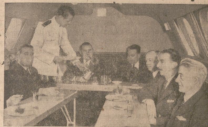
Comedor de un cuatrimotor «Sandringham Flying Boat», instalado en el piso superior del aparato.

Parece ser que pretendían unirse a una supuesta partida de bandoleros, engaño éste, como otros análogos, a los que conduce la propaganda que tanto la Prensa como la «radio» hacen desde el extranjero. Por la diligencia y el celo con que las fuerzas prestaron este servicio, el gobernador militar ha felicitado a cuantos tomaron parte, incluso a algunos vecinos que desde los primeros momentos colaboraron eficazmente en la captura de los malhechores, (Cifra).