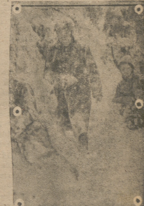
Una patrulla de la infantería alemana realizando una descubierta.

MEJICO, 2.—En la Conferencia de Chapultepec, la Delegación mejicana presentó una proposi-