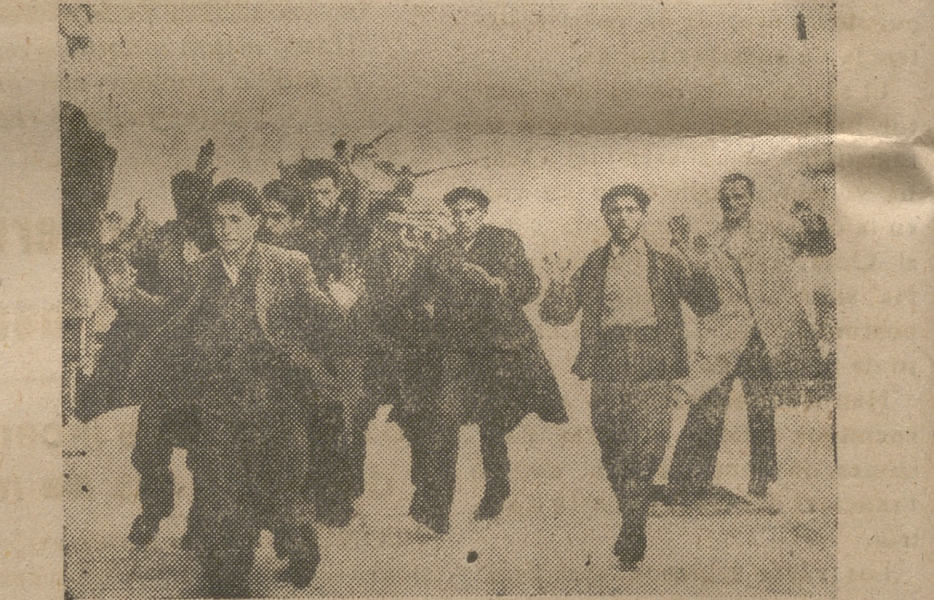
Prisioneros griegos del E. L. A. S. capturados por los ingleses durante los combates en Atenas.