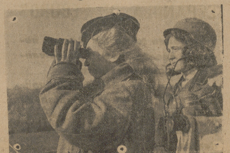
Las muchachas que prestan sus servicios en un puesto de observación de la Marina, sorprendidas durante el servicio.