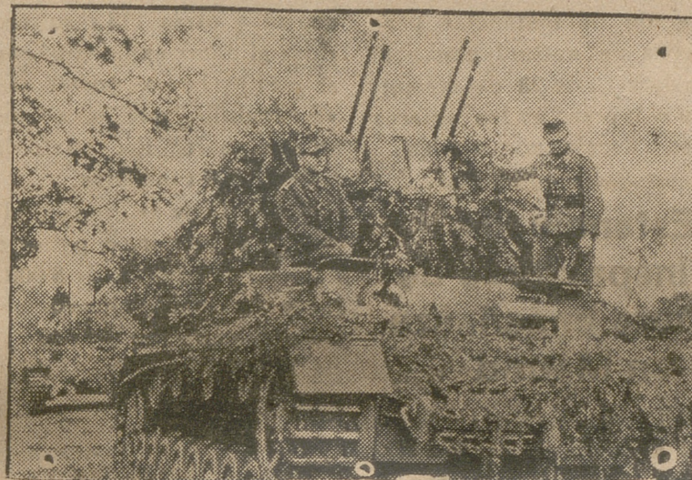
Una división tanquista en el frente occidental ha empezado a emplear con gran éxito baterías antiáreas automóviles.